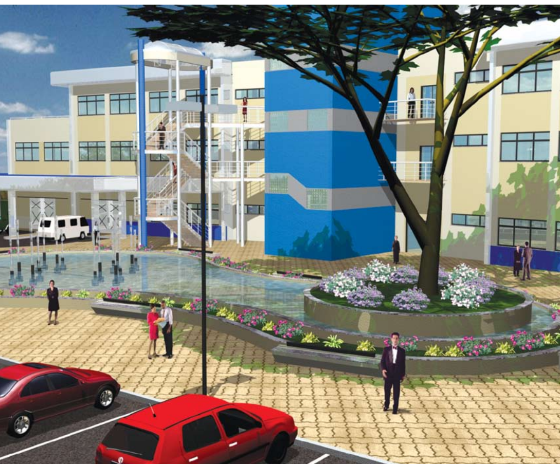
Assim como o prédio de Botucatu, outras edificações passarão por melhorias

Obras de emergência serão atendidas fora do plano, de acordo com o assessor-chefe da Aplo. Ele acrescenta que, quando um projeto tem a maior parte do custo financiada por outra instituição, ele também poderá ser contemplado. Um exemplo é a construção de um laboratório de Ciências da Computação no câmpus de São José do Rio Preto. A obra receberá uma verba federal de R$ 1 milhão, com uma contrapartida da Unesp de cerca de R$ 250 mil.