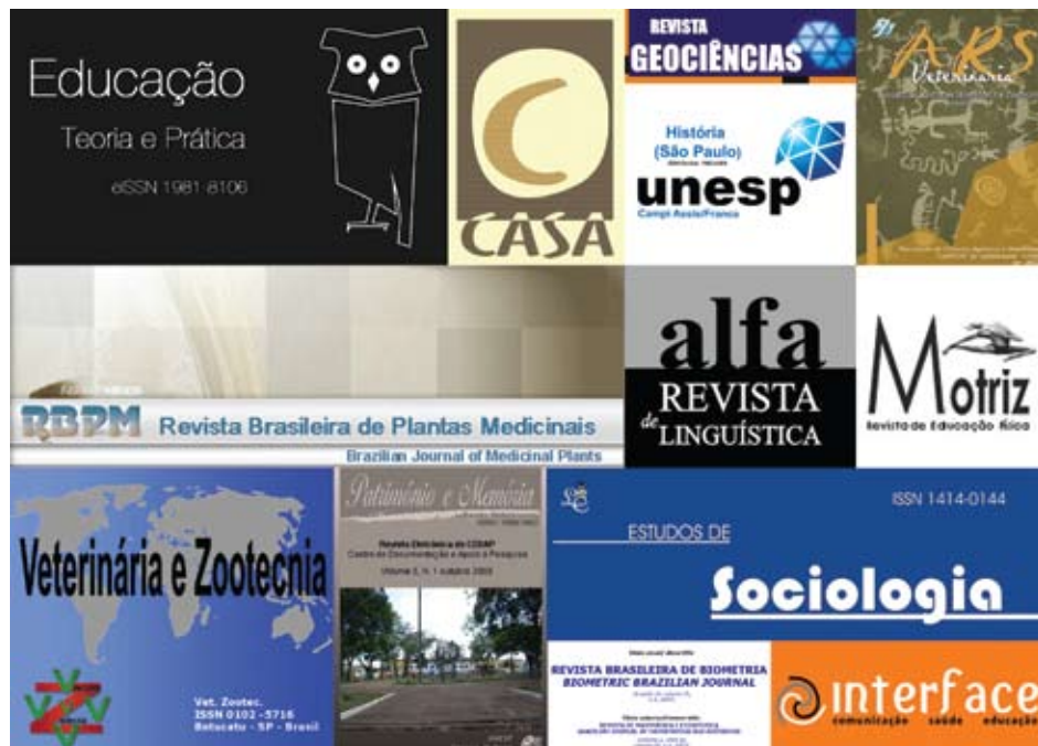
Com incentivo, periódicos da Unesp ganham mais reconhecimento internacional

A triagem das revistas foi realizada por meio do Programa de Apoio às Publicações Científicas Periódicas. A comissão de avaliação analisou 32 periódicos, seguindo um roteiro baseado em padrões internacionais utilizados pelas mais importantes bases de periódicos científicos, de acordo com a Prope.