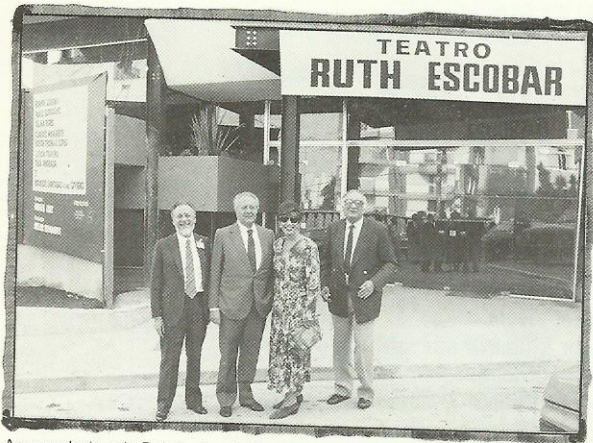
Acompanhado pelo Embaixador do Brasil em Portugal, Dr. Alberto Costa e Silva, o Presidente Mário Soares visita as obras do Teatro Ruth Escobar. À direita, Dr. António Alçada Baptista.